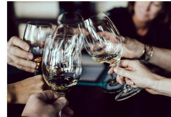
Cata de vino/cava en las bodegas