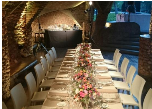
Cena de gala o tipo cóctel