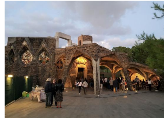
Copa de cava/vino en el porche