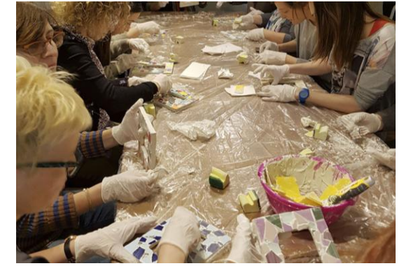
Actividad de trencadís