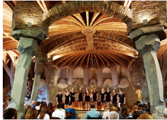
Concierto en el interior de la Cripta