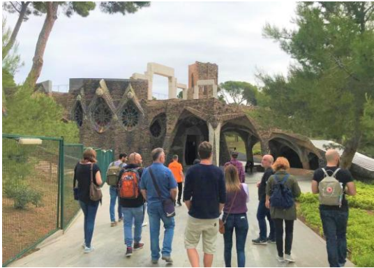
Visita guiada privada

El recinto dispone de diversos espacios singulares, tanto exteriores como interiores, en los que se pueden llevar a cabo actividades.